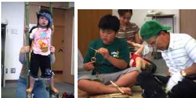
あんぶれらネットワークれんげの会「田んぼの学校」 あすてらすフェスティバル2006出展の様子

「あんぶれらネット ワーク」では、 あすてらすフェス ティバルでの「田 んぼの学校」をはじめ、各イベントに参加しています。春・ 秋の彼岸市では大田餅つき隊、久手の旧中部家畜市場で行 われる“モーモーフェスタ”での野菜、加工品の販売等な ど。また「味彩ネットワーク」の代表を務め、ロード銀山 の「ここだけシリーズ」に協力し、地産地消をテーマに加 工所設立、特産品開発へと努力しています。