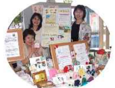
「母恵夢BAKU&希房」 手作り石けん、ストラップ等の販売