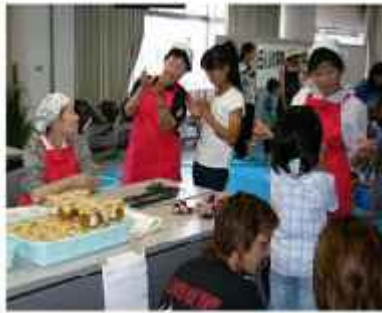
「あんぶれらネットワークれんげの会」 昔の遊びなどを体験することができました