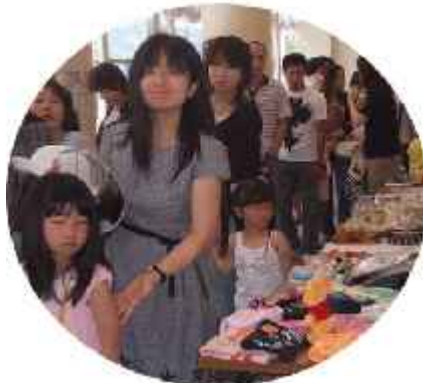
様々な世代の方にご来館いただきました