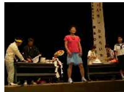
男女共同参画寸劇

宇宙飛行士の配偶者という立場から、女性の活躍やNASAにおける「家族」の定義などをお話ししていただき、男女共同参画社会を進める上で「日米における家族観の違い」について考えるきっかけとなりました。