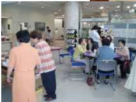
出雲市多伎町久村自治会女性部 あすてらすフェスティバル2006出展の様子