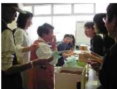
スタンプラリー抽選会場 「大当たり！」