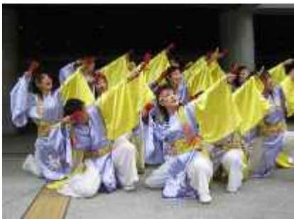
「和笑～なごみ～」迫力のよさこい踊り!