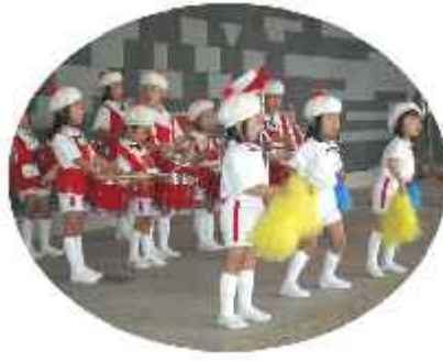
「五十猛保育園マーチングバンド」 かわいい演奏とダンスで会場は大賑わい