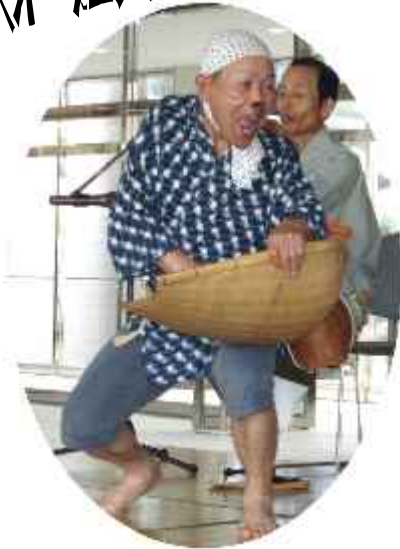
17日 みのり会「銭太鼓・安来節」