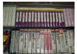
女性問題に関する図書やビデオがズラリ！