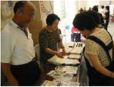
「石見銀山かるたの会」 石見銀山の魅力を親しみやすい絵札にしたかるたの販売