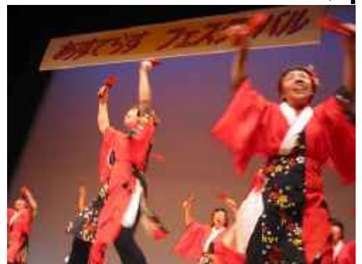
18日 舞踊グループ 出雲阿國 「杵築浜おどり」「おかみさんソーラン」