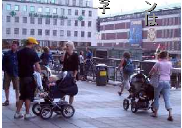
昨年はストックホルム県で史上最多の赤ちゃんが誕生し、育休パパも増加傾向のスウェーデン

「スウェーデンは世界一の“ママの国”」。先日読んだ新聞で、この見出しが目に飛び込んできました。国際NGO「セーブ・ザ・チルドレン」が実施した「世界の母親」に関する調査でスウェーデンが第1位になったのです。この調査は、「子どもの福祉は母親の福祉の上に成り立つ」という理念にもとづき、母親の識字率、避妊手段の利用率、出産時の医療支援等を総合して国際比較したものの。ちなみに日本は第12位でした。比較項目の中に国会議員における女性の比率が含まれていたのが影響したようです。しかし、女性の政治参画が子どもの福祉に繋がるという発想は注目に値します。女性が自分の体について自己決定し、必要な医療援助が得られ、かつ、生活に直結する政治にも参画できる、そんな国でこそ、子どもは健やかに育つということなのでしょう。