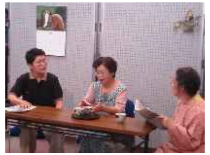
「出雲女性フォーラム」 『あなたはどちら?』川柳で表す男女共同参画寸劇