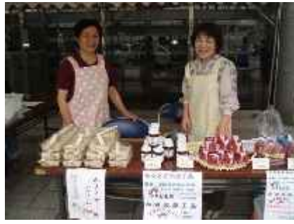
「多伎町ヤマモモの会」 炊き込みご飯等の販売