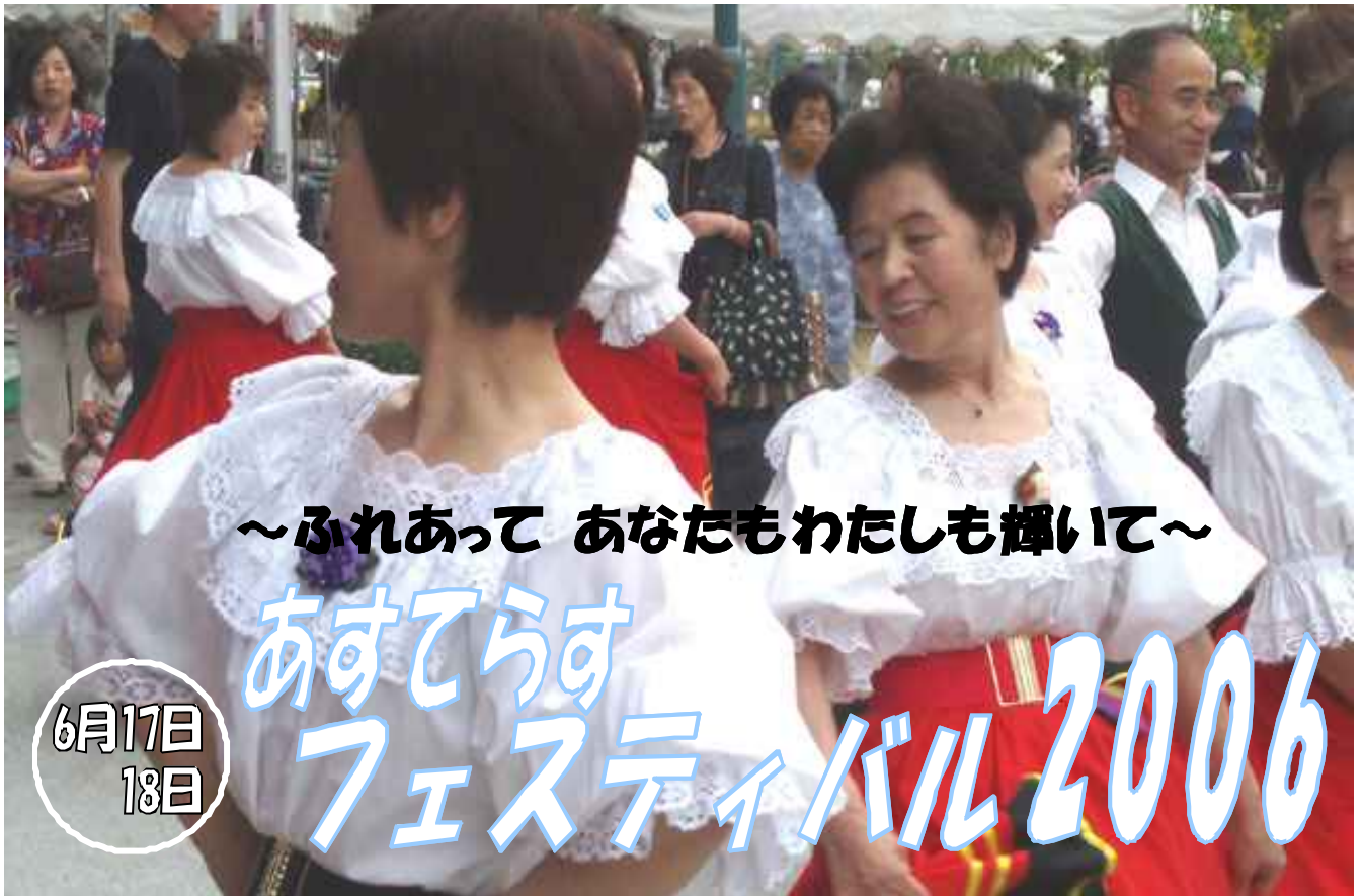
「益田フォークダンスの会」優雅なフォークダンスを披露していただきました

男女共同参画推進月間である6月に、島根県男女共同参画サポーターの有志で構成された「あすてらすサポートクラブ」と(財)しまね女性センターが協働でフェスティバルを開催しました。男女共同参画セミナーや講演ライブをはじめ、県内各地で様々な活動をしている71の個人やグループによる自主企画イベントが催されました。両日とも多くの皆様にご来場いただき大盛況の内に終了しました。