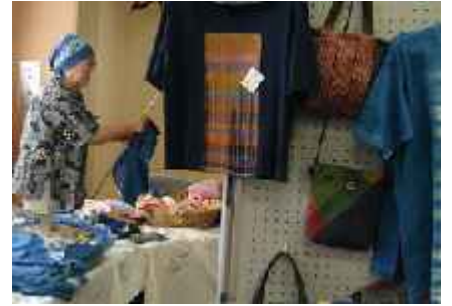
「紺屋谷体験工房」 のれんやハンカチ等の染物、織物の販売