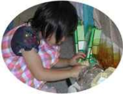
素敵なものがたくさんあってなやんじゃうよ～