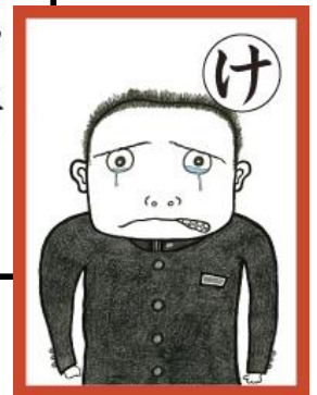
男女共同参画かるた 絵：玉井 詞