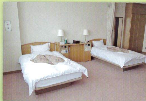
多目的宿泊室 (車椅子の方も安心してご利用できます)