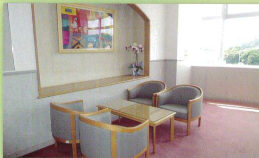
エレベータホール