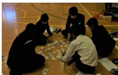
▲白熱するかるた大会